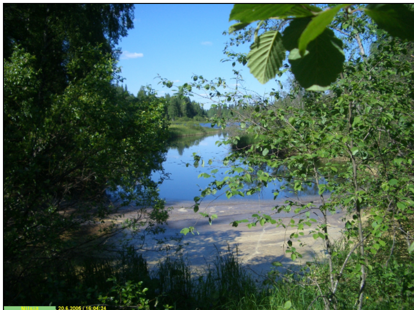
Näkymä Petäjälahden pohjukasta pohjoiseen